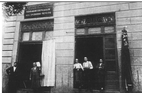
La "bottega de Angelino" e la "sartoria de Lombardi"