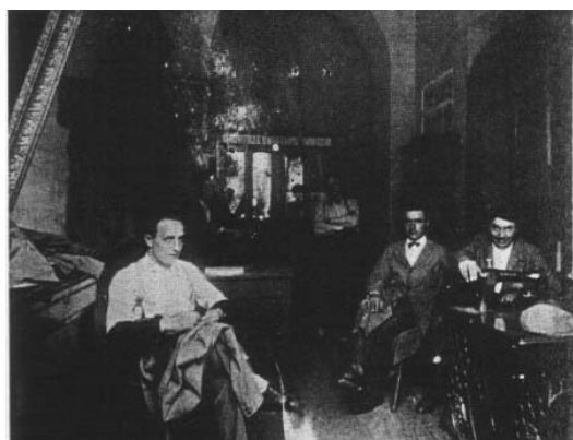
Interno della sartoria