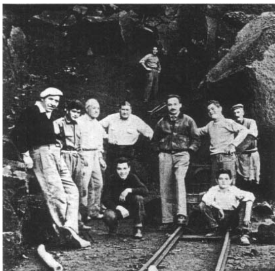
La cava di Monte Salomone