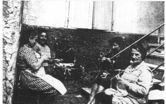
1968 Le comari, mentre chiacchierano si lavora all'uncinetto!