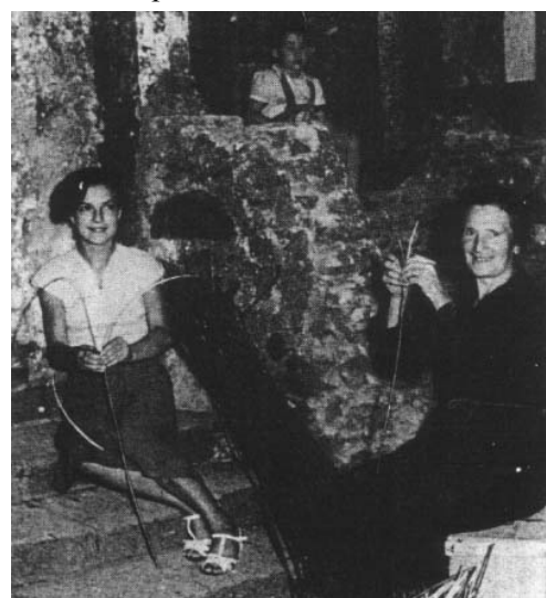
La spaccatura de "li sauci"