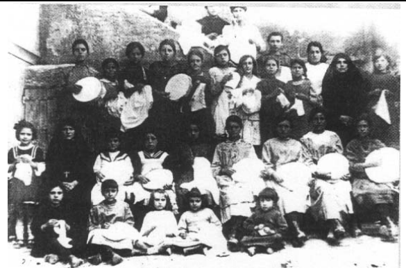
1920 Scuola di ricamo