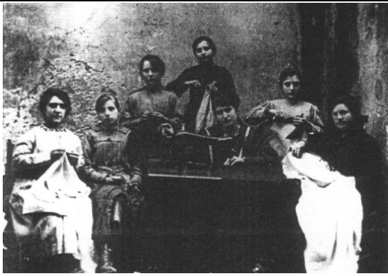
1920 Scuola di Cucito