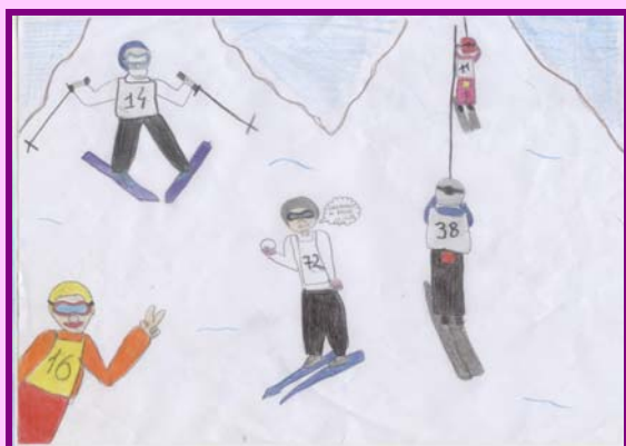
I C Sec. C.U. "Camposcuola sci"