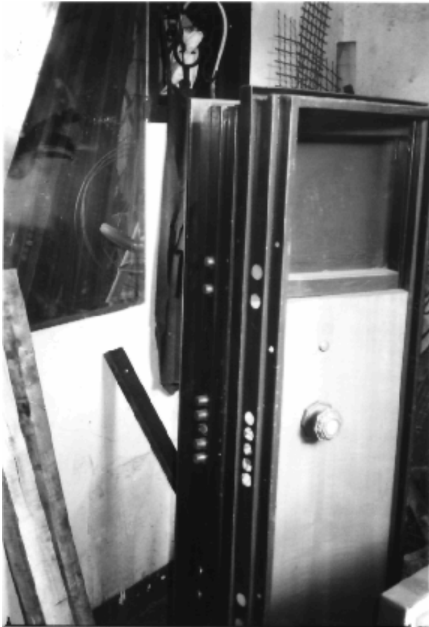
Porta Blindata, uno dei prodotti del Sig. BACCANI