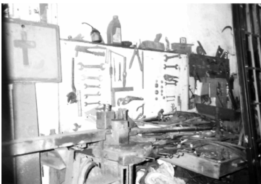
Lo scaffale degli attrezzi

Il suo, è un lavoro molto faticoso, gli permette sì, di avere un medio tenore di vita, ma gli richiede molti sacrifici: sta poco in famiglia, non